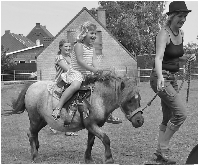
Plezier voor de kleintjes